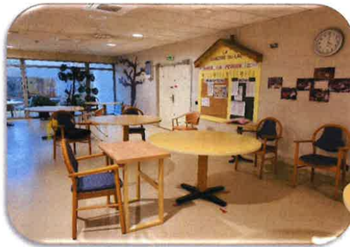
Salle à manger rez-de-chaussée

L'établissement dispose de 3 salles à manger (une par niveau), conviviales et chaleureuses, afin de vous accueillir pour les principaux repas de la journée. Toutefois, si votre état de santé le nécessite, les repas sont pris en chambre.