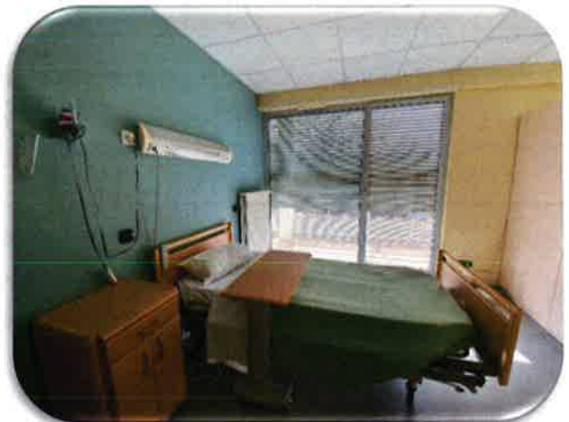
Chambre double 1 er et 2 ème étage